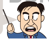
図 物の基本的区分