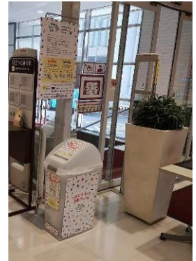
ダイエー神戸三宮店

2021年10月11日 フィルムリサイクル現場見学&技術検討会 (花王和歌山研究所パイロットプラント)