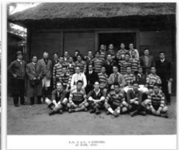
ラグビーの対戦チーム同士（1918, 神戸）