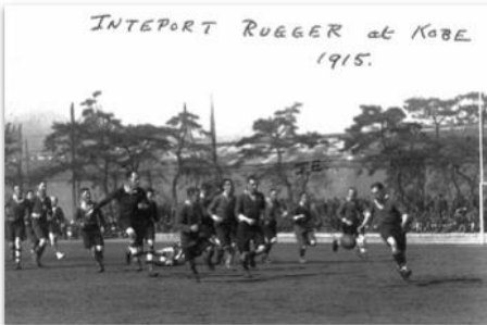
ラグビーの試合風景（1915, 神戸）