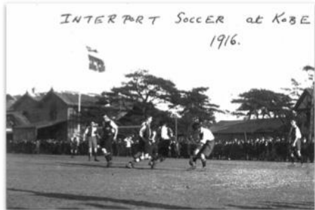
サッカーの試合風景（1916, 神戸）

日本での黎明期に神戸で盛んにおこなわれた「サッカー」「ラグビー」などの歴史を感じさせる貴重な写真や、地元で活躍しているプロスポーツチームの紹介なども施設内で展開いたします。