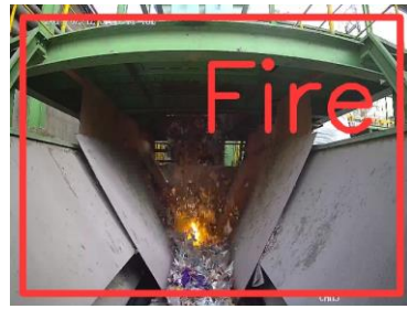
システムによる火花検知の様子