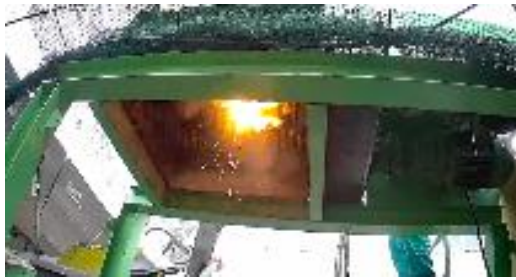
リチウムイオン電池破碎の瞬間